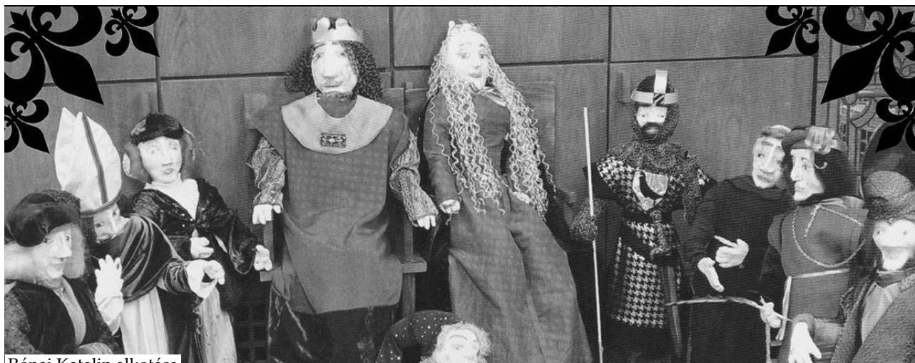
Rónai Katalin alkotása

5. szlovákiai megnyitójára az alkotókat és az érdeklődőket! Kérem, jelezzék utazási szándékukat a gyorgyie36@t-online.hu e-mail címen, vagy a 20/493–5412 telefonon, hogy az utazás módját megbeszélhessük.