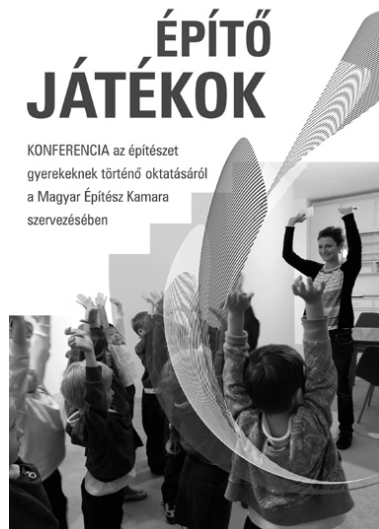
KONFERENCIA az építészet gyerekeknek történő oktatásáról a Magyar Építész Kamara szervezésében

A programot – amely ingyenes volt és amelyet élénk érdeklődés kísért – kötetlen beszélgetés zárta. Tanúi lehettünk olyan kezdeményezésnek, amikor civil szervezet vállalkozott a Nemzeti Alaptantervbe bejuttatni szakmai gondolatait, felhasználva számos egyéni kezdeményezésű, eredményes műhelymunka